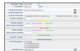
Versatile Custom Checks