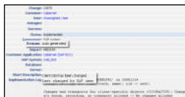
Automated Change Control